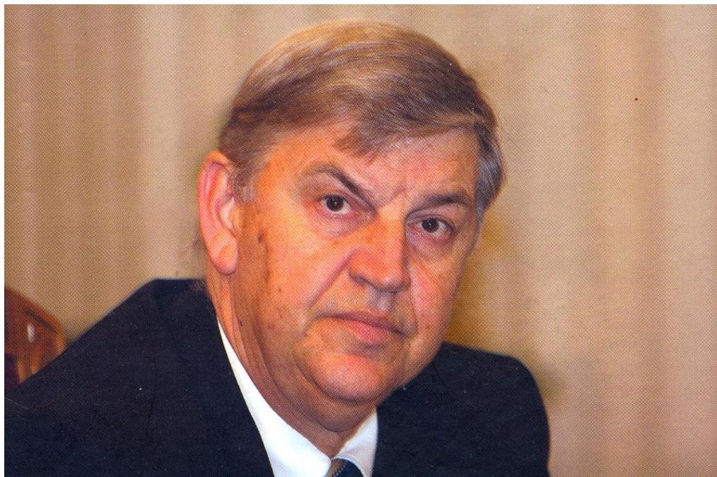
Проф. дмн Дамян Дамянов, действителен член на БАН

песимистичните прогнози и прекаления оптимизъм“ (1998 г.); „За ролята и мястото на Съюза на учените в трансформиращото се гражданско общество“ (1999 г.); „Младите хора в науката на прага на XXI век“; „Полезните изводи от дискусиата „Младите в науката“ (2000 г.); „Съюзът на учените в България (СУБ) и проблеми на науката и висшето образование (2001 г.); „Диалог от монолози не може да има“ (2001 г.); „Науката и висшето образование – приоритети на националното ни развитие (2002 г.); „Наука, околна среда, устойчиво развитие“ (2002 г.); „Отново за науката, образованието и традициите“ (2002 г.); „Необходима е дългосрочна държавна политика по въпроса за реемиграцията“ (2003 г.);